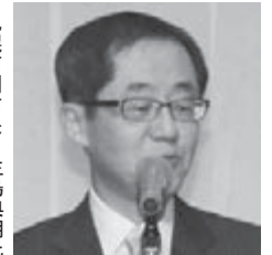
札幌市副市長 生島典明氏