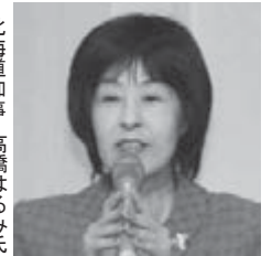
北海道知事 高橋はるみ氏