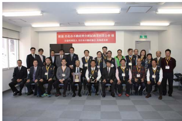
参加者全員による記念撮影