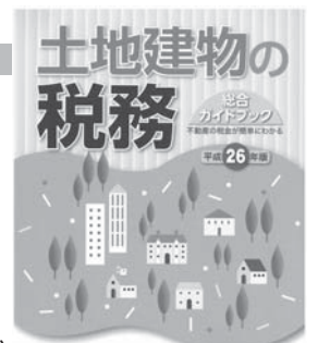
公社理事長 全日本不動産協会 北海道本部