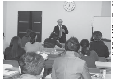
第1回目の講義の様子

定員は35名（4月2日時点の受講生は28名）で、途中受講も可能ですので、受講希望者の方は事務局（☎011-232-0550）までご連絡ください。