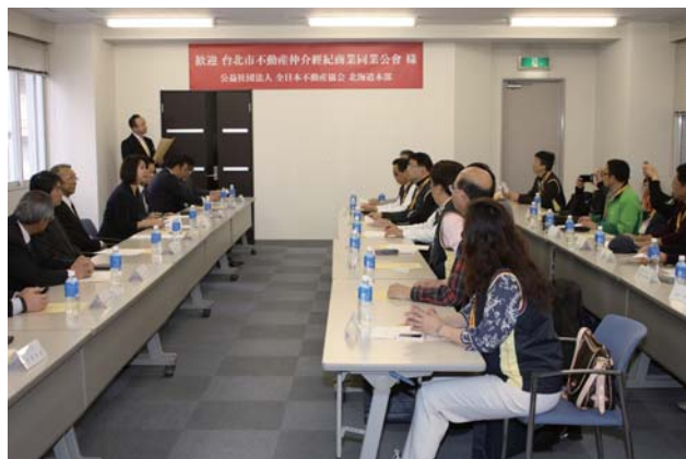
互いの友好の輪が広がる