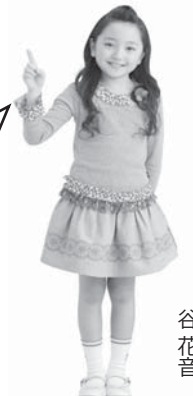
全日本不動産協会イメージキャラクター 谷花音

全日イメージキャラクター 谷花音(たに・かのん)ちゃんの写真素材使用申請や報酬額表のダウンロードも追加されました。ぜひご利用ください。