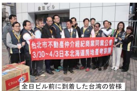
全日ビル前に到着した台湾の皆様