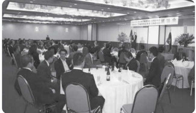
懇親を深める会員