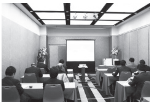
釧路地区法定義務研修会の様子

平成 29 年 2 月 3 日（金）、札幌コンベンションセンター（札幌市白石区）にて開催した第 4 回法定義務研修会の講義をユーストリームを利用して生中継し、岩見沢市、帯広市、釧路市の各会場において、法定義務研修会を開催しました。