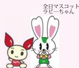
献血キャラクター けんけつちゃん

献血協力のために会場にお越し下さる方のほか、買い物にいられてその場で立ち寄ってくださる方、協会会員の方、計55名の協力を得ることができました。ご協力ありがとうございました。