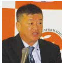
三國成能副本部長

また、セミナー終了後は、講師らが相談員となり、不動産や引越しに関する相談会なども開催し、多くのご相談をお受けしました。