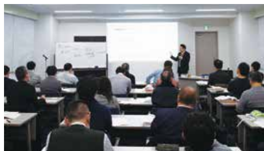
平成 30 年 2 月 21 日（水）、全日ビル 3 階会議室において開催された平成 29 年度第 5 回宅建士法定講習の様子

平成 30 年度第 1 回法定講習は 4 月 24 日（火）にサン・リフレ函館で実施し、11 名が受講しました。