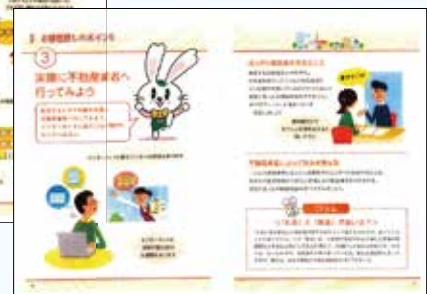
セミナーで配布された(公社)全日本不動産協会が制作した「部屋探しお役立ちガイド」