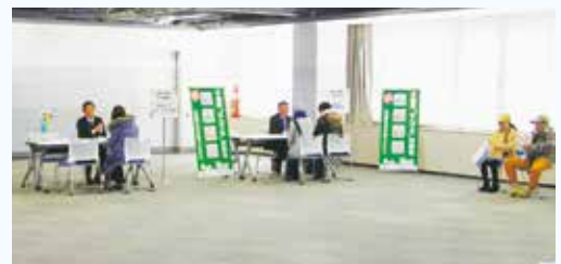
セミナー終了後に開催された 相談会の様子