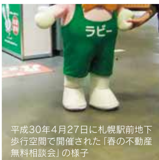
平成30年4月27日に札幌駅前地下歩行空間で開催された「春の不動産無料相談会」の様子