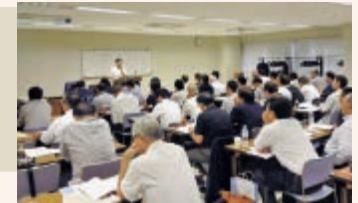
平成30年9月5日(水)に開催された平成30年度第3回宅建士法定講習の様子

今年度は残り2回(上記参照)、次年度は6回の開催を予定しています。更新忘れなどないよう計画的な受講をお願いします。なお、次年度の開催日程は決まり次第、お知らせいたします。