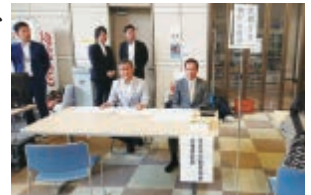
平成 30 年北海道胆振東部地震について

平成 30 年度法定義務研修会開催日程 平成 30 年度第 1 回道南ブロック 法定義務研修会 平成 30 年度第 2 回法定義務研修会 宅地建物取引士法定講習 日程等 平成 30 年度ステップアップトレーニング～売買基礎編～