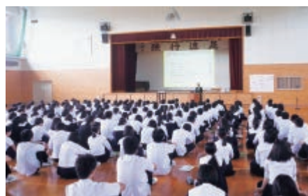
北海道北見北斗高等学校(9月25日)

生徒の皆さんは、真剣な面持ちで耳を傾けて下さり、講演後のアンケートでは「いままで知らなかったことを知ることが出来て、より一人暮らしのイメージがわかりました」「親に頼りすぎずに部屋を選びたい」「自分でもいろいろ調べてみようと思いました」などの感想が寄せられました。