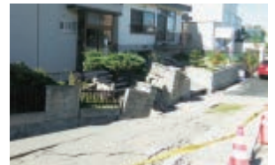
震災と消費税増税の札幌の住宅不動産市場への影響

不動産なんでも相談会 in 函館 賃貸住宅フェア 2018 in 札幌 全国一斉不動産無料相談会 秋の不動産無料相談会