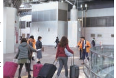
オリジナルティッシュ配布の様子

駅構内には、全国不動産会議石川県大会の懸垂幕が掲げられ、大会開催を盛り上げていました。