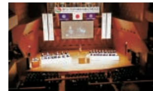
第 54 回全国不動産会議石川県大会

室蘭市との協定締結について 頒布品のご紹介 / 全日忘年会 / 新年交礼会 宅地建物取引士合格祝賀会の開催について 北海道本部事務局 年末年始休業のお知らせ 全日北海道オレンジリボン チャリティゴルフコンペ中止について