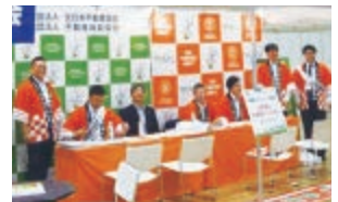
賃貸住宅フェア 2018 in 札幌

キャンペーンのご案内 「新入会員ご紹介のお願い」 「入会費用 10 万円減額キャンペーン」