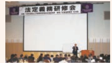
平成30年10月11日(木)に札幌で開催された平成30年度第2回法定義務研修会の様子。今回は同研修会の録画を用いて、北見(10/23)、函館・旭川・帯広(10/25)、小樽(10/26)、室蘭(11/16)の6拠点で法定義務研修会を開催しました