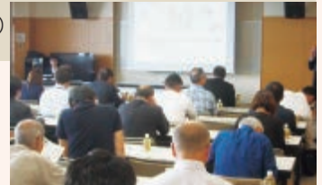
第1回道南ブロック法定義務研修会は、サン・リフレ函館(函館市)を会場に開催し、65社68名が出席しました