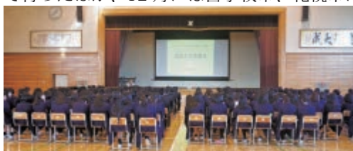
北海道釧路北陽高等学校(10月31日)

今年度は平成30年9月25日(火)の北海道北見北斗高等学校をはじめ、北海道釧路北陽高等学校(10/31釧路市)、北海道登別青嶺高等学校(11/16登別市)で行ったほか、12月には苫小牧市、札幌市において講演を行う予定です。