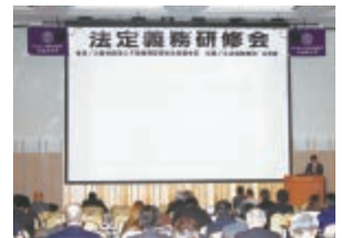
平成30年度第3回法定義務研修会

高等学校卒業生向け講演「一人暮らしのマナー講座」 オレンジリボンチャリティ忘年会兼交流会 カレンダーリサイクル市2019