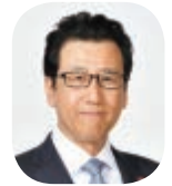
秋元克広 札幌市長