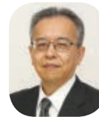
水島徹治 北海道開発局長