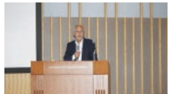
第3回法定義務研修会札幌会場の様子