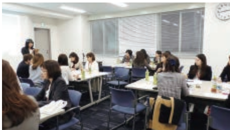
1部「相手を理解するマインドマップ術」の様子

このマインドマップ術は題材を決め、直感、創造、連想で思考(アイデア)を広げてマップを作り上げていきます。出来上がったマップから「題材にまつわるもの全体を俯瞰することができ、優先順位にとらわれずに作られたマップで今までの自分の思考を超える発見ができる」といった利点があります。