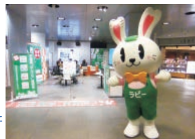
平成30年4月27日（金）に開催された春の不動産無料相談会の様子

日時：平成31年4月8日（月）10：30～18：00 会場：札幌駅前通地下歩行空間