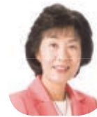
高橋はるみ 北海道知事