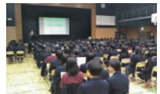
高等学校卒業生向け講演 「一人暮らしのマナー講座」

全日北海道青年部会 平成30年度第3回定例会・ 第4回定例会新年会兼情報交流会 全日コスモス会 研修会