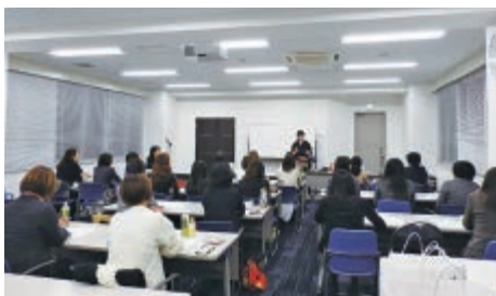
2部「女は見た目でも運命が変わる」の様子

マインドマップ作りが初めての方も多かったのですが、脳のシナプスを連想させる図をカラフルに描いていく手法と題材を不動産関係としたことで参加者にスムーズに受け入れられ、自然に各グループが活発に意見を交わしながらワークすることができました。