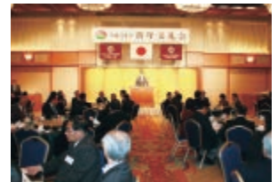
平成31年新年交礼会

法定義務研修会 平成30年度ステップアップトレーニング 宅地建物取引士法定講習 スキルアップ講座