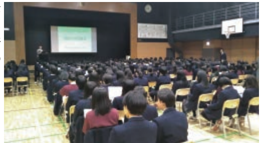
札幌北斗高等学校 (12月13日)

講演のご依頼等につきましては、北海道本部事務局 011-232-0550 までお問い合わせ下さい。