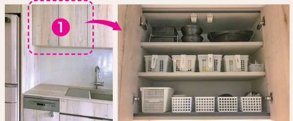
①は毎日使う収納棚。朝と夜に使うモノをまとめている。