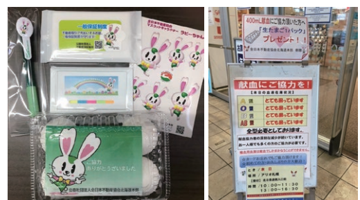
マスコットキャラクター ラビーちゃん