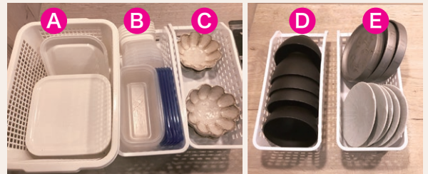
Aはタッパー大。朝に夕ご飯の仕込みした食材を入れたり隙間時間に常備菜を作ったり、夜の残りを入れたりで大活躍。Bはタッパー中・小。残り少ない食材を入れ替えたり常備菜を入れたりところも大活躍。Cは小鉢。こちらも副菜を入れるのに毎日使用。Dはお椀(朝晩)、E小皿(朝晩)。