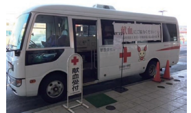
献血協力の様子(令和2年3月18日)