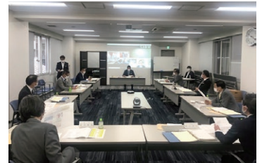
テレビ会議システムを利用した理事会の様子 (令和2年5月26日)

公益社団法人 全日本不動産協会 北海道本部 第40回定時総会 公益社団法人 不動産保証協会 北海道本部 第40回定時総会 一般社団法人 全国不動産協会 北海道本部 第1回定時総会 令和2年度 ブロック・部会定時総会 令和2年度 役員名簿 令和2年度 永年会員感謝状受賞者