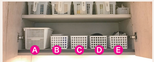
A・B・Cは扉下段に収納。毎日使う食器なので出し入れしやすい場所を確保。