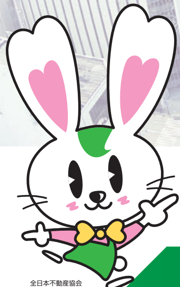
全日本不動産協会 マスコットキャラクター ラビーちゃん