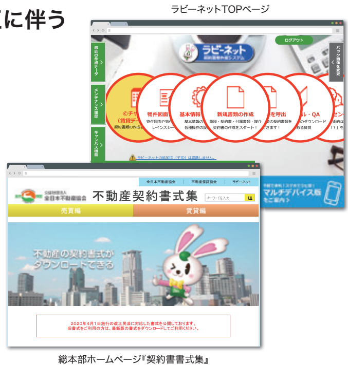
総本部ホームページ『契約書書式集』

また、北海道本部ホームページの「北海道本部からのお知らせ(令和2年8月11日)」 ※2 には、以下の資料を掲載しておりますので、ご参照ください。