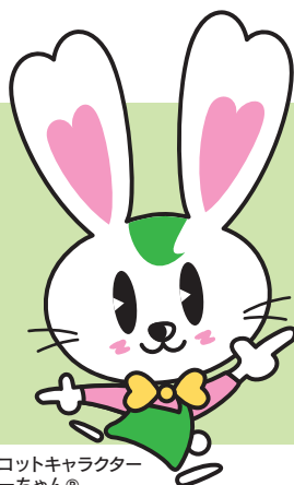
マスクットキャラクター ラビーちゃん®