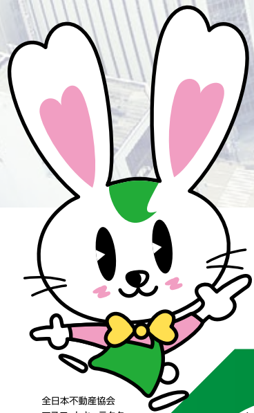
全日本不動産協会 マスコットキャラクター ラビーちゃん