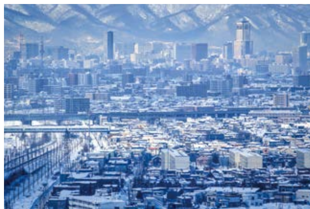
北海道の空き家戸数は約38万戸。住宅総数に占める割合は13.5%と推計されている(2018年国の住宅・土地統計調査より)。

こういった地域の問題は、法律の力だけではなかなか解決しないという側面もあります。そこで注目されるようになってきたのが、ランドバンク。自治体、地域の宅建業者、NPO法人などがタッグを組んで空き地や空き家の解決方法を模索していくという組織で、この考え方が誕生したのはアメリカ合衆国となります。設立は1970年代で、その目的は空き家や所有者不明土地・建物を取得し、管理・開発すること。ミシガン州・オハイオ州などで発展し、リーマンショック以降はアメリカ全土へと広がっていきました。