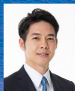
北海道 鈴木 直道 知事