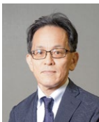
北海道開発局 坂場 武彦 局長