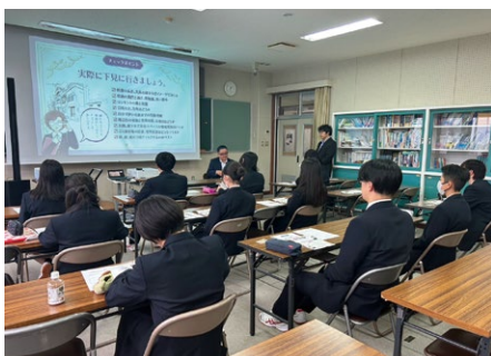
平取高等学校での様子

北海道本部は今後も一人暮らしのマナー講座を継続実施し、生活トラブル未然防止の一助を担っていきたくと考えております。