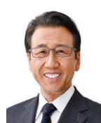
札幌市 秋元 克広 市長