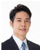
北海道 鈴木 直道 知事