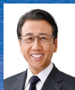
札幌市 秋元 克広 市長