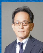
北海道開発局 坂場 武彦 局長