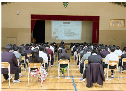
旭川明成高等学校での様子