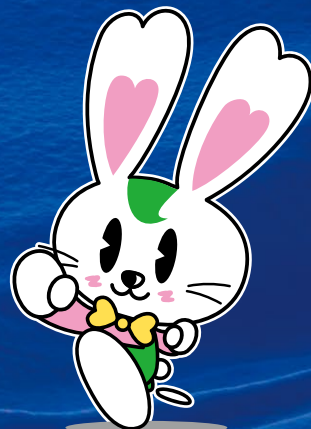
マスコットキャラクター ラビーちゃん®