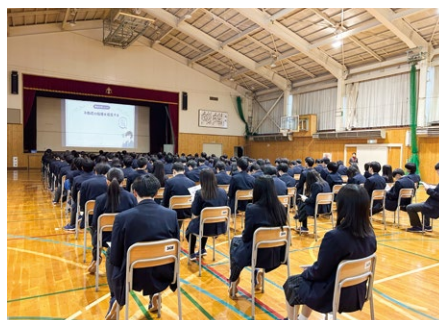
室蘭東翔高等学校での様子